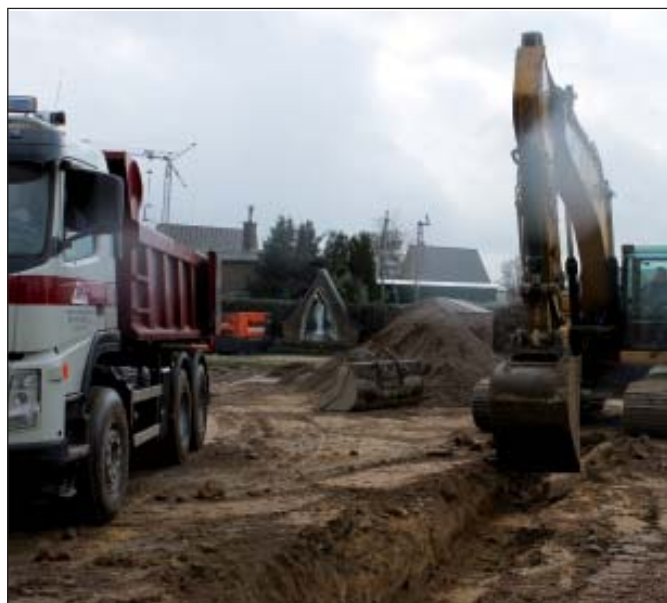
De voorbereidende werken aan het gemeenschapscentrum te Molenbeersel zijn midden februari gestart.

De eigenlijke wegeniswerken starten op 2 april.