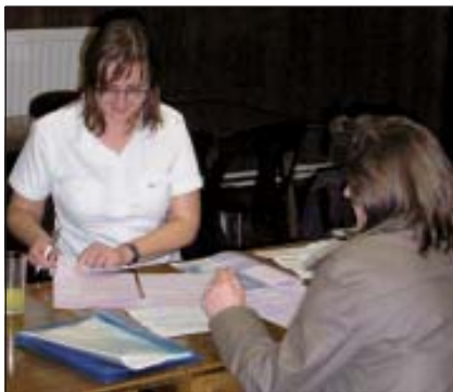
Dankzij onze dienstverlening kunnen vele grensarbeiders jaarlijks een bedrag terugvorderen van de belastingdienst

Naar jaarlijkse gewoonte helpen we de grensarbeiders bij het invullen van hun C-biljetten. Dit jaar organiseren we samen met Jong CD&V-Kinrooi twee invulsessies, nl. op: