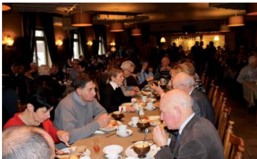
Zo'n 200 sympathisanten kwamen meegenieten van de heerlijke Nieuwjaarsbrunch!