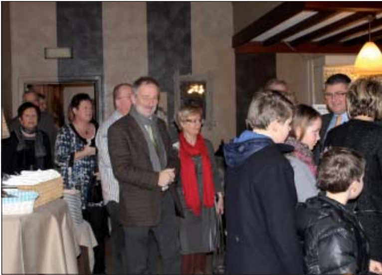
Het was aanschuiven bij het binnenkomen in Oppenhof.