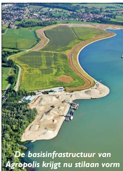
De basisinfrastructuur van Agropolis krijgt nu stilaan vorm

kunnen verwelkomen. Onze projectmanagers zijn vandaag al bezig met het zoeken naar geschikte activiteiten in het kader van vernieuwende en duurzame land- en tuinbouw.