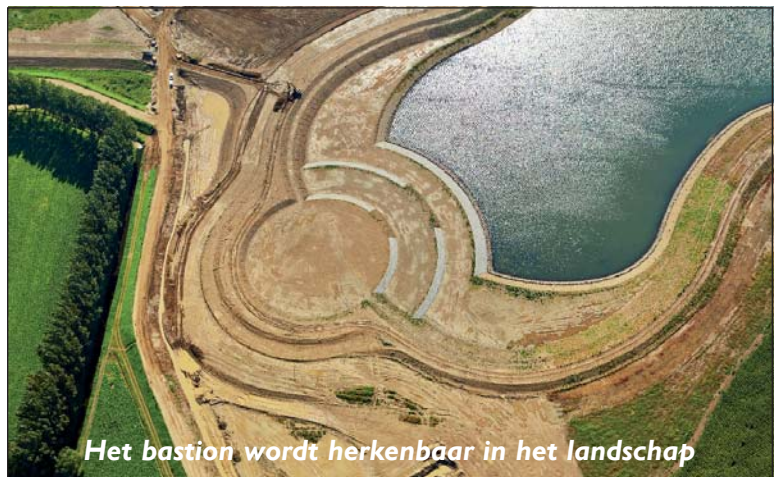
Het bastion wordt herkenbaar in het landschap

Op het terrein zelf worden in 2015 de hoofdwegen en de nutsleidingen aangelegd (hiervoor krijgen we 1,25 miljoen euro vanuit het SALK) zodat we hopelijk vanaf 2016 de eerste bedrijven