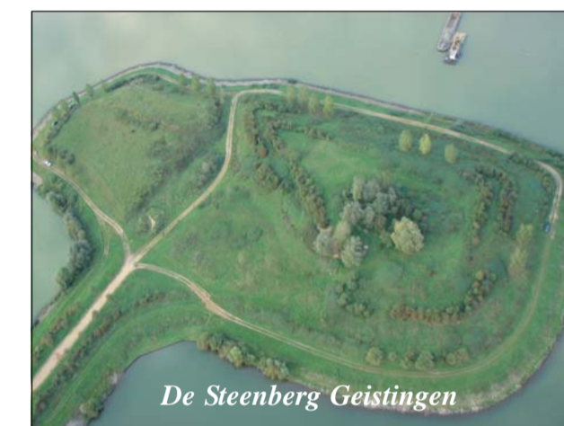
De Steenberg Geistingen

De procedure voor de aanvraag van de bouwvergunning is momenteel lopende. Het openbaar onderzoek is afgelopen. Nu is het wachten op de bouwvergunning die we hopelijk binnenkort zullen krijgen. Daarna zal onmiddellijk de aanbesteding van de werken gebeuren.